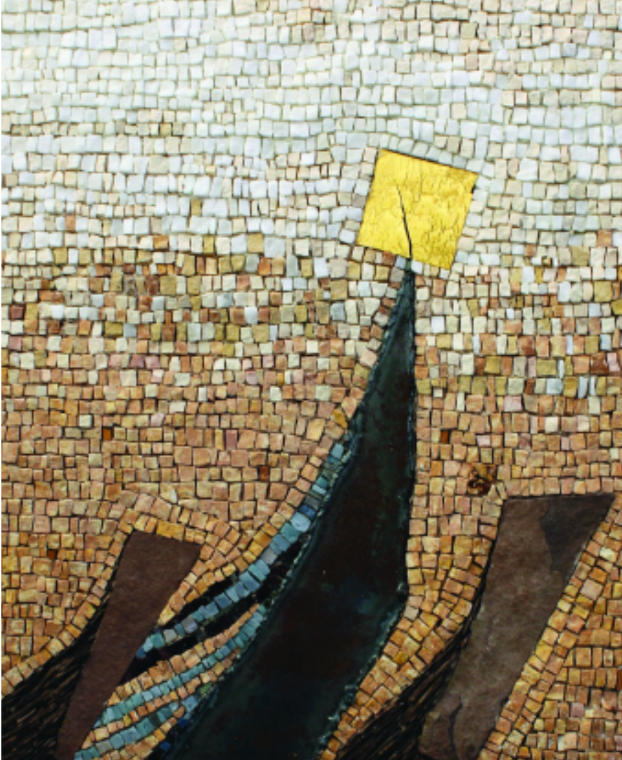
They Kept Going