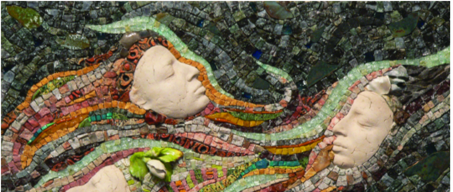
Chronos - 0,91 x 0,61